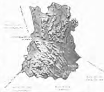
Municipio de Guadalcázar

Actualmente el Estado de San Luis Potosí es una entidad con alto índice de concentración demográfica y económica en algunos municipios (San Luis Potosí, Ciudad Valles, Matehuala y Río Verde) 1 , esto ha generado una desigualdad de oportunidades para el desarrollo del resto de los municipios, sobre todo en la Zona Altiplano y específicamente en el Municipio de Guadalcázar.