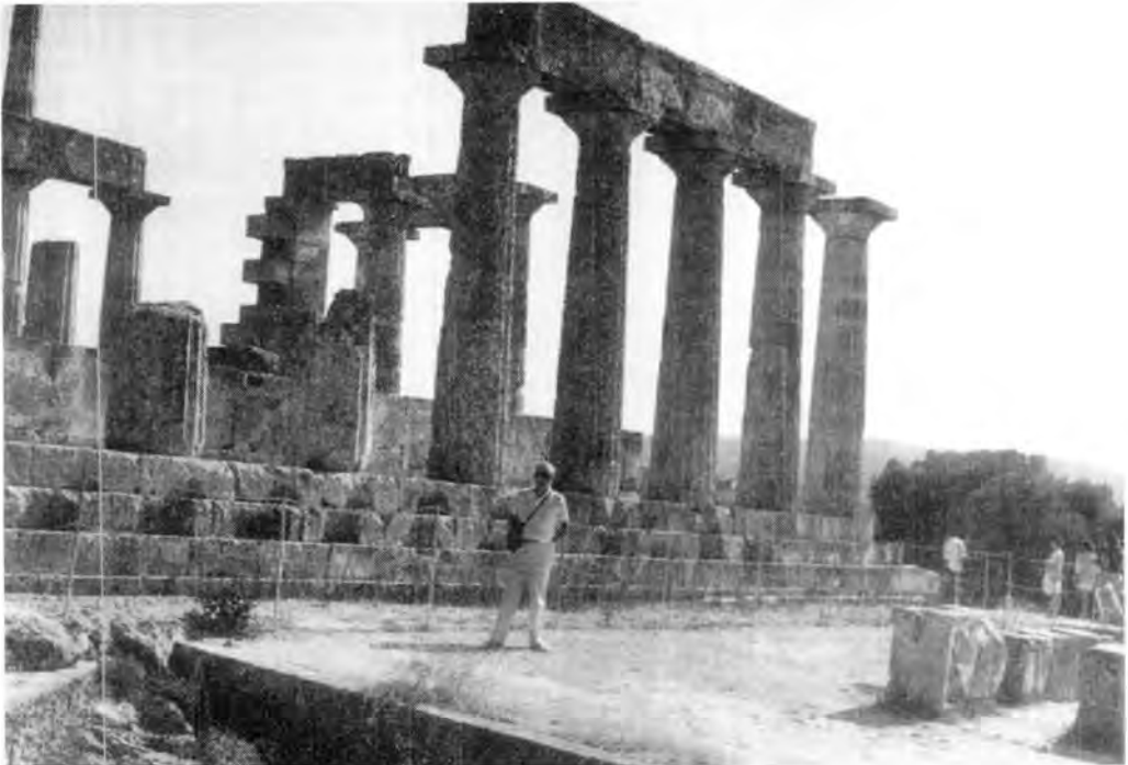
Ruinas del templo a la Diosa Atea. Grecia.

Un pasajero español nos advirtió: "Si van a Grecia, van a indigestarse de tanta piedra labrada".