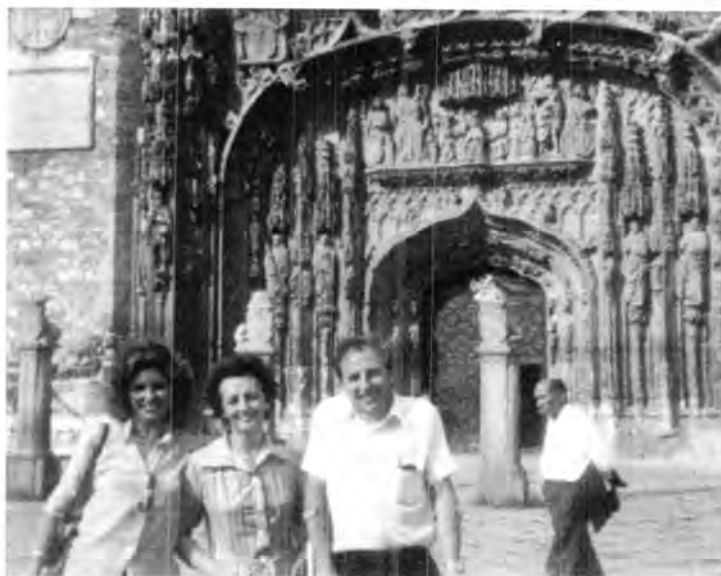
Pórtico de la Basílica de Santiago de Compostela, España.

Dicen quienes asisten a las numerosas concentraciones de fieles que el "botafumeiro" se usa más para aminorar los malos olores de millares de peregrinos, que recorren grandes distancias, que por razones de culto, para fortuna nuestra presenciamos cómo numerosos grupos de jóvenes realizaban este peregrinar. Las peregrinaciones las iniciaron los reyes de Francia en 1154, desde entonces miles de peregrinos europeos vienen a venerar al patrón de España.