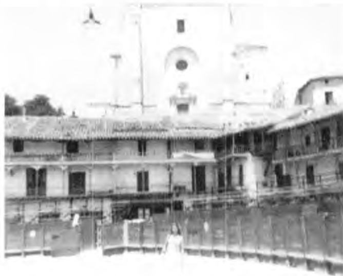
Plaza de toros. Chinchón, España.

gentes sin dejar de ser amables, hablan con la franca rudeza del castellano.