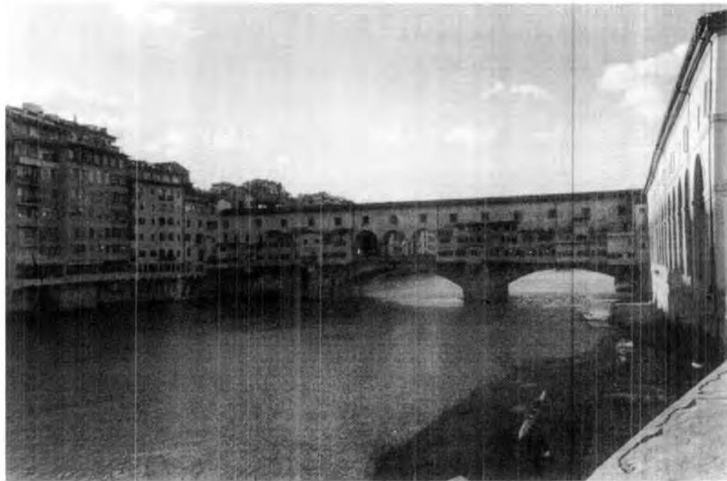
Puente Vecchio. Venecia.

construir una ciudad en el mar? Al desmoronarse el imperio romano, los bárbaros invadieron Italia, esto fue el origen de Venecia en el siglo V, su construcción tiene un parecido a la de Tenochtitlan, (esta sobre los lagos y Venecia sobre el mar), en un centenar de pequeñas islas del mar Adriático, con troncos de encina, que bajo el agua se petrificaban, fueron terraplenando y dejan-