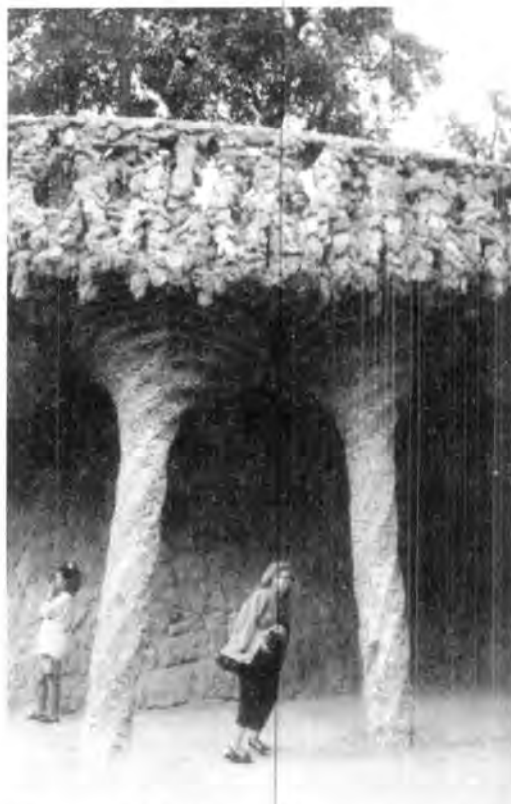
Vist parcial de la fachada del museo de Gaudí, en el paque Güel. Barcelona España.

Conocimos otras obras de Gaudí, que demuestran su audacia innovadora: el parque Güell, de quince hectáreas que donó el conde de ese apellido a la ciudad, para que fuera colonia residencial; condicionando a que fuera Gaudí quien realizara los proyectos y sus construcciones. Al no hacerse la colonia residencial, se hizo un parque, donde espaciosos jardines sirven de marco a las obras que dirigió Gaudí: desde el pabellón-portería con una columna que