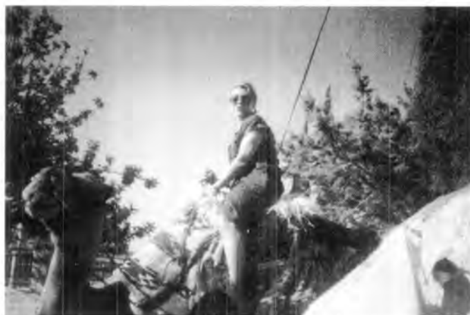
El camello, uno de los medios de transporte todavía en uso, sobre todo para recorrer el desierto. Israel.

Nos llamó la atención de cómo en todo Israel, se cuidan mucho la flora y la fauna (1988). Se ven plantaciones de palmeras datileras y de parras, como oasis en medio del desierto, donde riegan con agua traída de Jerusalén, aquí el agua es tan escasa que nos hace pensar con gran preocupación la contaminación torpe e irresponsable de los ríos de la Huasteca.