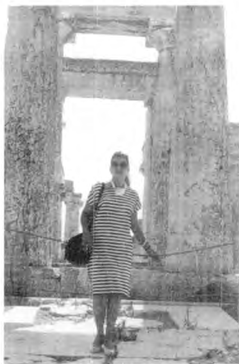
Vista parcial del pórtico de la Acrópolis. Atenas.

hoy frente a sus ruinas nos extasiamos al contemplar lo que un poeta llamó "el florecimiento de su inmutable juventud". Hombres como Cicerón, Ovidio, Horacio y Virgilio, vivieron aquí las impresiones más grandes de sus vidas y su mayor inspiración.