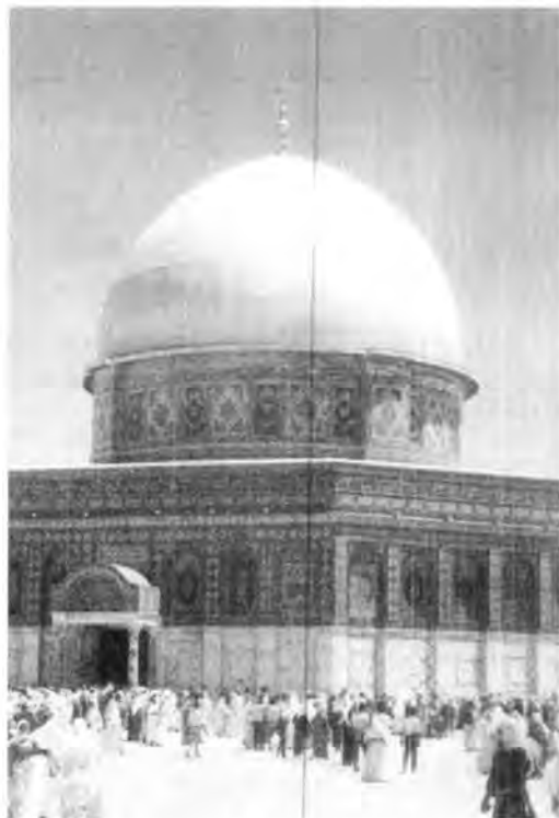
Mezquita de Omar. Jerusalén.

religiones: Judaísmo y Cristianismo, siendo por lo mismo, centro de atención por dos milenios por un número cada vez mayor de personas. Además ocupa un lugar muy importante en la veneración y pensamiento religioso del Islam por lo que este pequeño país se ha constituido en Tierra Santa para tres grandes confesiones: judaísmo, islamismo y cristianismo.