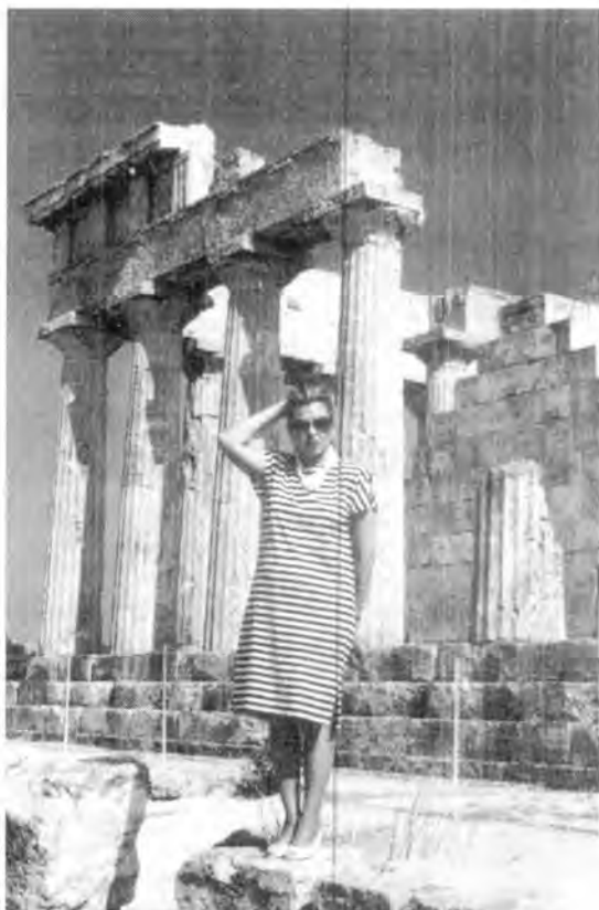
Ruinas del Templo a la Diosa Aphaia. Grecia.

guramente en Tierra Santa, habrá sitios que conocimos y hoy pudieran estar deteriorados o destruidos por la guerra entre palestinos e israelíes.