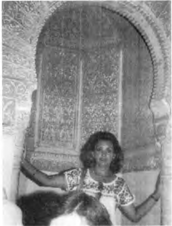
Detalle de la Alhambra. Granada, España

ruinosos torreones parecen “colgados” en las agrestes montañas.