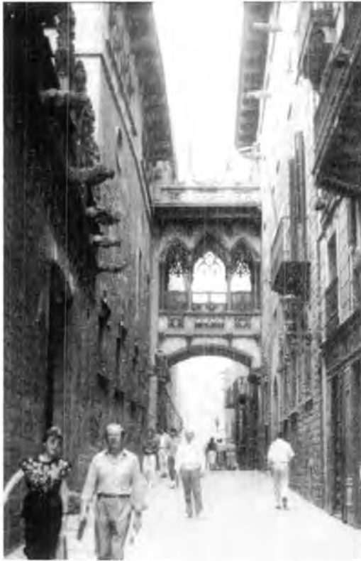
Calle en el barrio gótico. Barcelona, España.