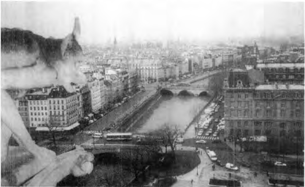
Vista parcial del Río Sena. París.

francesísimo “Molino Rojo” 7 a los nuevos “Lido” o “El caballo loco”, en los tres se presentan revistas musicales y sus bailarinas nudistas de fama mundial; porque tiene para mí mayor simbolismo La Sorbona, creada para estudiantes pobres, que el que pudiera tener la Estatua de la Libertad, regalo de Francia a la Ciudad de Nueva York. Como me pareció más bella la Basílica del Sagrado Corazón situada en el Monte de los Mártires 8 que la catedral de Notre Dame.