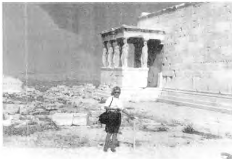
Vista lateral de la Acrópolis. Atenas.

o "azine" 102 , más bien refiriéndose metafóricamente a su grandeza artística y su mentalidad, aunque algunos historiadores, consideran esta palabra de Atenas como de origen etrusco significando "ciudad protegida por la diosa Azine o Atenea".