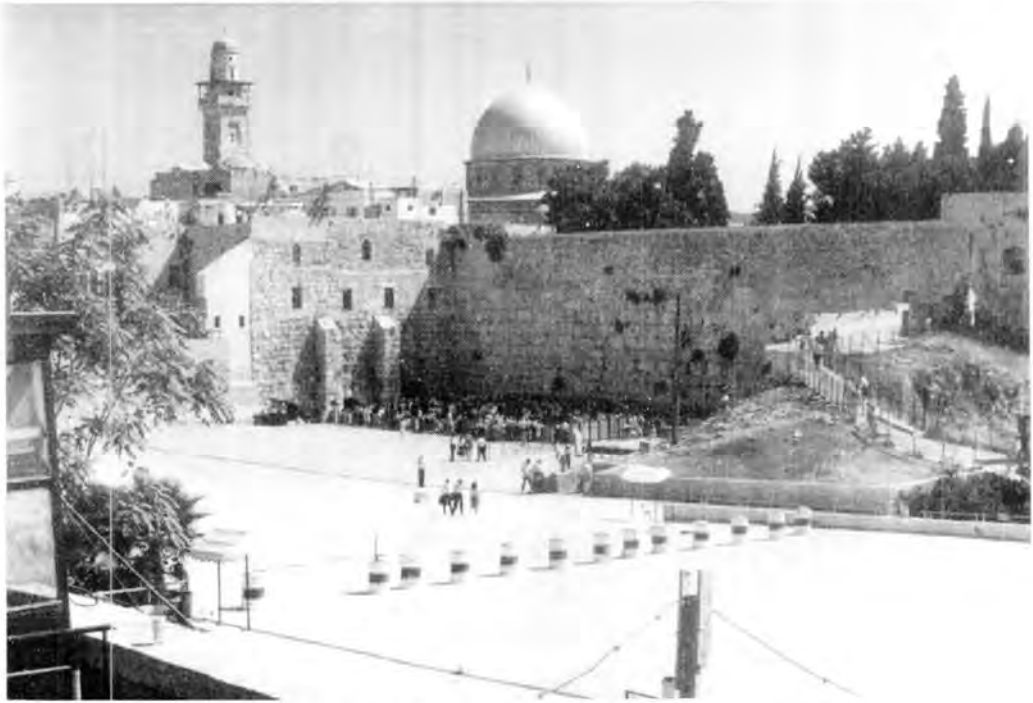
Muro de las Lamentaciones. Jerusalén.

El muro occidental, mejor conocido como el “muro de los lamentos” o “Kótel Hamá´araví” en hebreo, era parte de las murallas que rodeaban la zona del segundo templo, en tiempos de Herodes. Pues bien, nos tocó visitarlo precisamente en sábado 121 , el día de la oración según la ley de Moisés; el diario saludo “shalom” 122 se convierte en Shabat Shalom , o sea “sába-