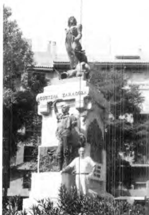
Manumento a Agustina de Aragón. Zaragoza, España.

con los famosos fueros , cuando los Reyes Católicos, establecen su corte en Zaragoza, el hermoso palacio árabe de Aljafería, vuelve a ser sede real.