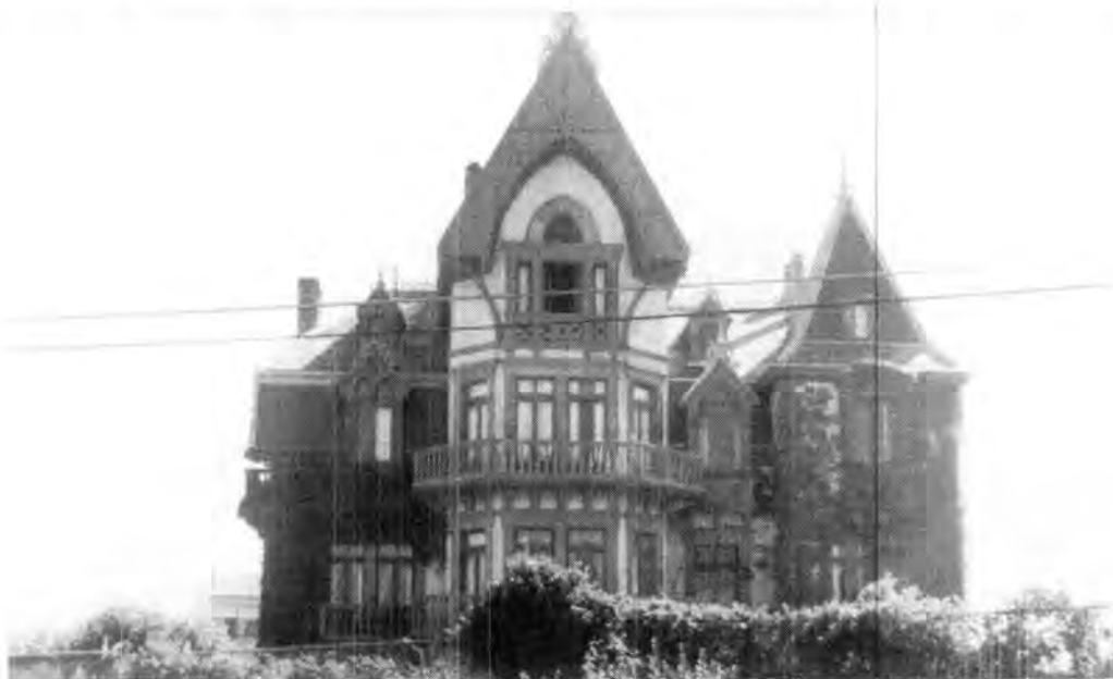
Casa construída por "indianos", en Cantabria, España.

llamó la atención, su gran alzada, mansedumbre y enormes ubres, sin