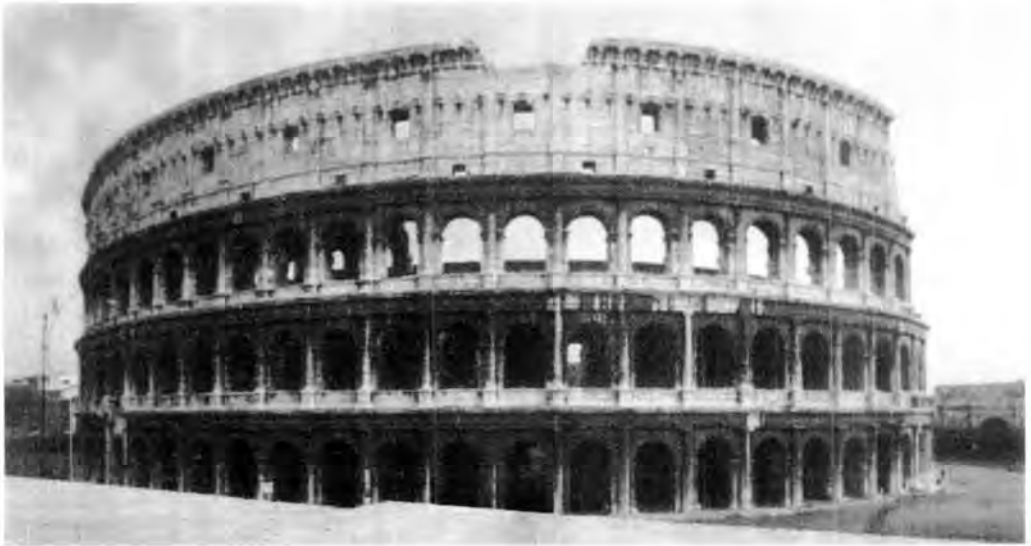
Coliseo romano. Roma.

garantizados? Recordé esta sentencia: “A un hambriento, no le regales el pescado, mejor, enséñale a pescar”.