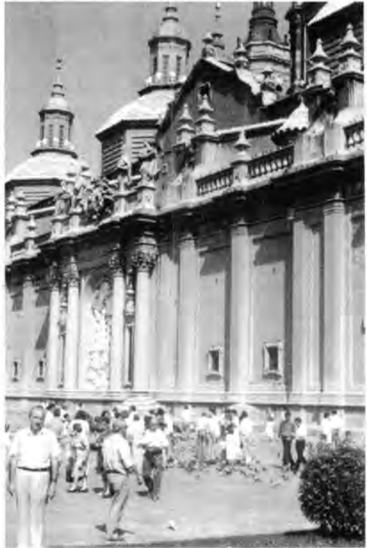
Vista lateral de la Basílica del Pilar. Zaragoza España.

En la Basílica del Pilar, señorial templo que data del siglo XVII, destacan sus diez cúpulas revestidas de azulejos de colores, la central, de grandes proporciones y cuatro torres, y su fachada de estilo neoclásico. Tiene tres naves separadas por doce pilares enormes, mide 130 metros del largo por 65 metros de ancho. En el altar mayor, al centro, está el venerado pilar de jaspe que mide dos metros de altura por veinticinco centímetros de diámetro, y sobre el mismo, la imagen de la Virgen, en talla de madera estilo gótico, de medio metro de altura, emblema de la fe aragonesa y a la que ellos llaman familiarmente "La Pila-