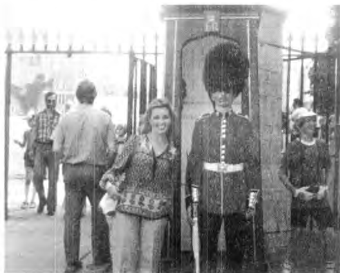
La esposa del autor, junto a un clásico guardia real inglés.

En la calle llamada de Los Millonarios, conocí (por fuera) el palacete de la entonces inquieta princesa Margarita, y muy cerca la embajada de la URSS (cuando era comunista! Uno de los monumentos que más me llamó la atención, es el dedicado al príncipe Alberto, el germano esposo de la reina Victoria, de hermoso estilo gótico.