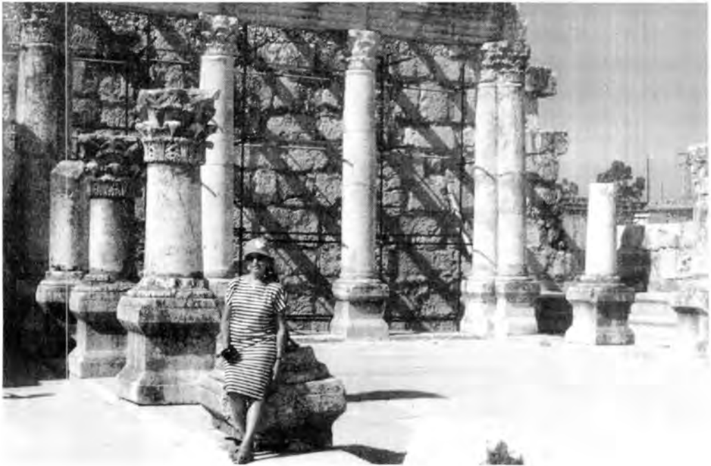
Ruinas romanas. Jerusalén.

quedan murallas de la vieja ciudad. Ahora es un balneario de moda, con elegantes hoteles y restaurantes frente a la playa, donde sirven el "pescado de San Pedro, que es un pez con forma de huachinango, pero color amarillo grisáceo, que sabe a robalo, y que con pan árabe y ensaladas nos costó trece dólares la ración; como referencia, una cerveza costaba en el verano de 1988, cuatro veces lo que nos cuesta en México, y ni comparación a la exquisita mexicana.