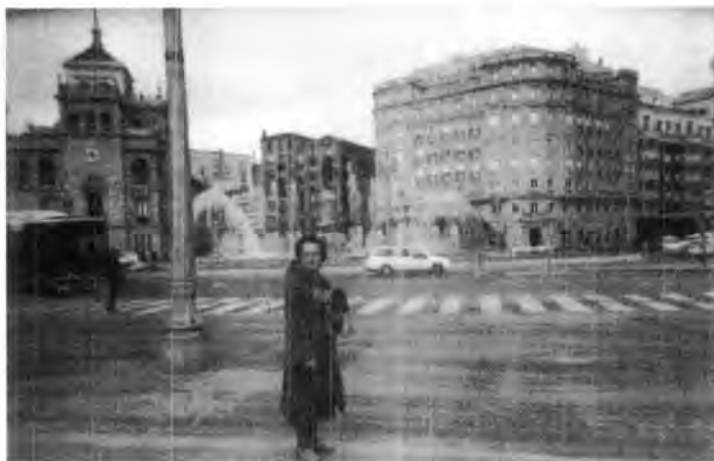
Paseo Zorrilla. Valladolid, España.

Al día siguiente, tomamos el “tren rápido” en Chamartín, terminal ferroviaria, funcional y limpia. Pudimos observar los diferentes tipos de personas: el tímido provinciano, el desenfado de los jóvenes, el “estiramiento” de los “señoritos” y la parsimonia de los empleados. Íbamos para Valladolid: centro estudiantil, ciudad de trescientos cincuenta mil habitantes (1979). En el siglo XII, el Rey de León, ordenó a don Pedro Anzures, que poblara el “Valle de Olid”, de ahí su nombre.