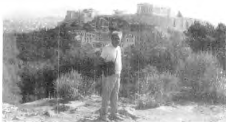
Panorámica de Atenas, al fondo la Acrópolis.

pesinos mexicanos que se van a los "Yunaited Esteits"?).