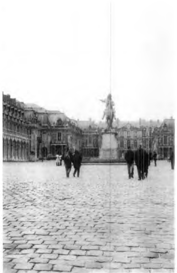
Plaza en la ciudad de París, destacando el monumento a Napoleón.

ca y no comer zacahuil. Es aquí donde se ven los automóviles más feos y los más hermosos, particularmente los deportivos de perfectas líneas. El aeropuerto de París es un orgullo para Francia, verdadero alarde arquitectónico.