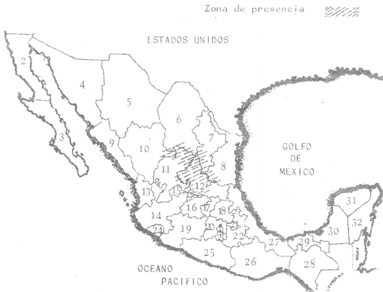
DISTRIBUCION GEOGRAFICA DE Asphodelus fistulosus , EN LA REPUBLICA MEXICANA