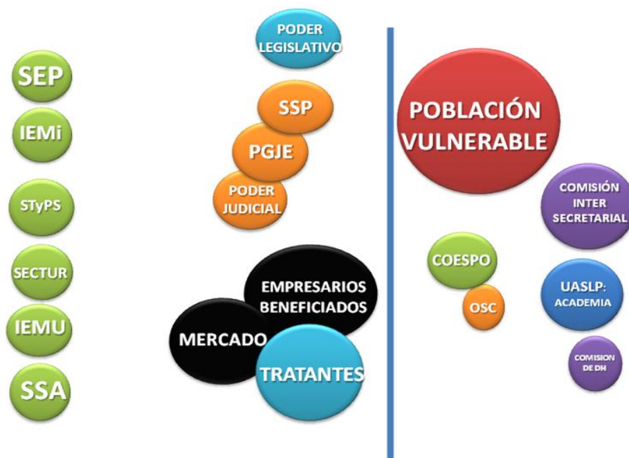
Cuadro 2: Mapa de Actores y Agentes en Conflicto 24 .

trabajar este tema, las acciones que se llevan a cabo están en constante movimiento, mayoritariamente provenientes de las organizaciones de la sociedad civil: