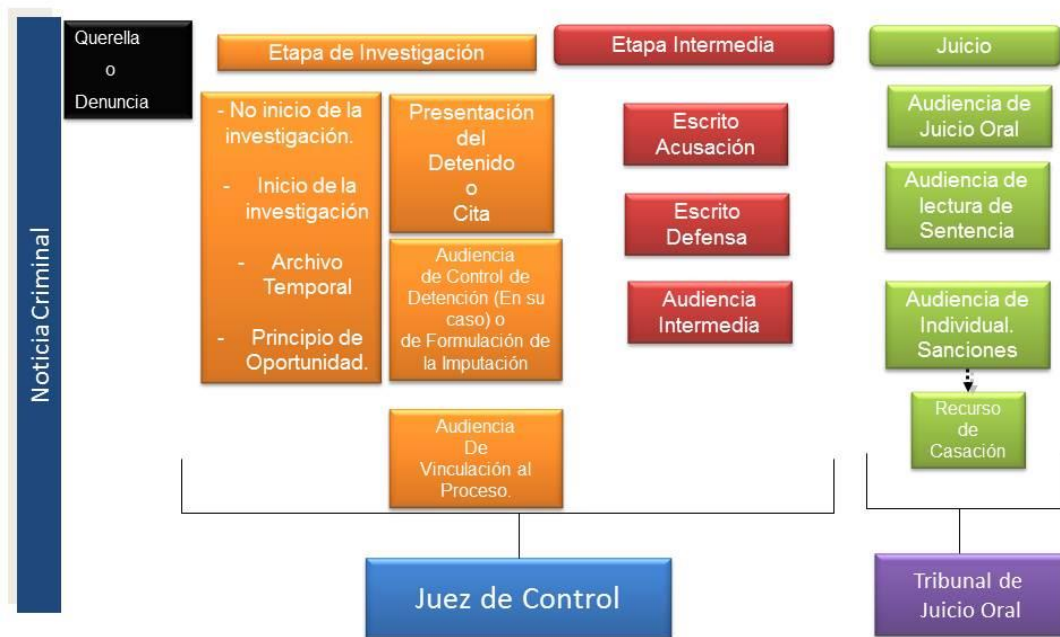
Cuadro 4: Mapa del Procedimiento Penal Acusatorio 96 ,

El proceso penal, según se ha definido en el Código Federal de Procedimientos Penales, así como en los códigos de los Estados que ya reformaron sus constituciones y trabajan en la implementación de este sistema, tendrá por objeto el esclarecimiento de los hechos, de la verdad histórica, garantizar la aplicación del derecho, proteger al inocente, procurar que el culpable no