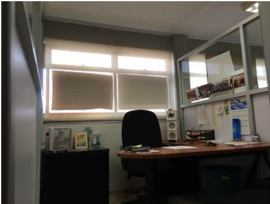
Ilustración 6: Cubículo de un defensor público