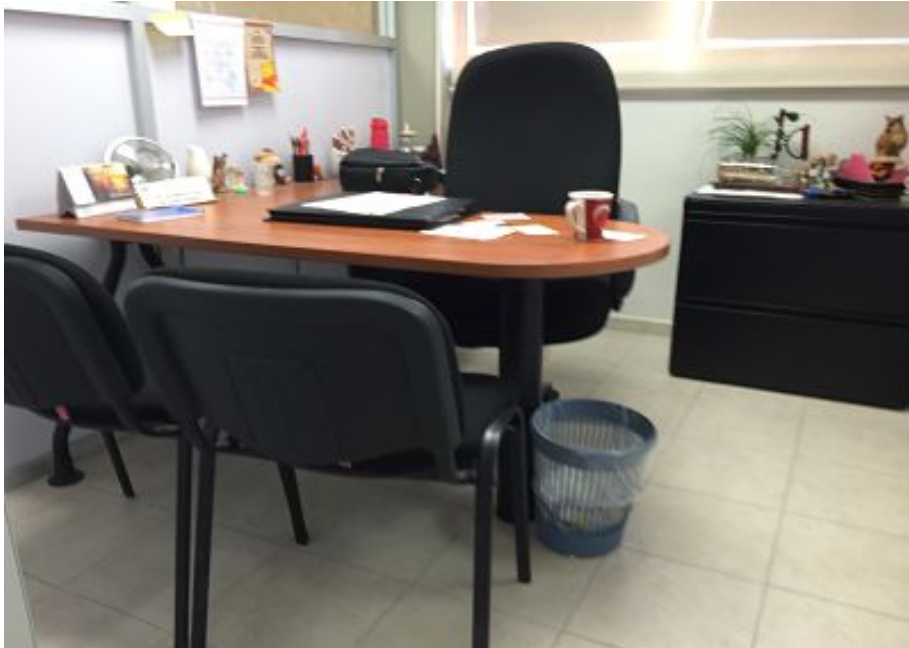
Ilustración 5: Cubículo de un defensor público