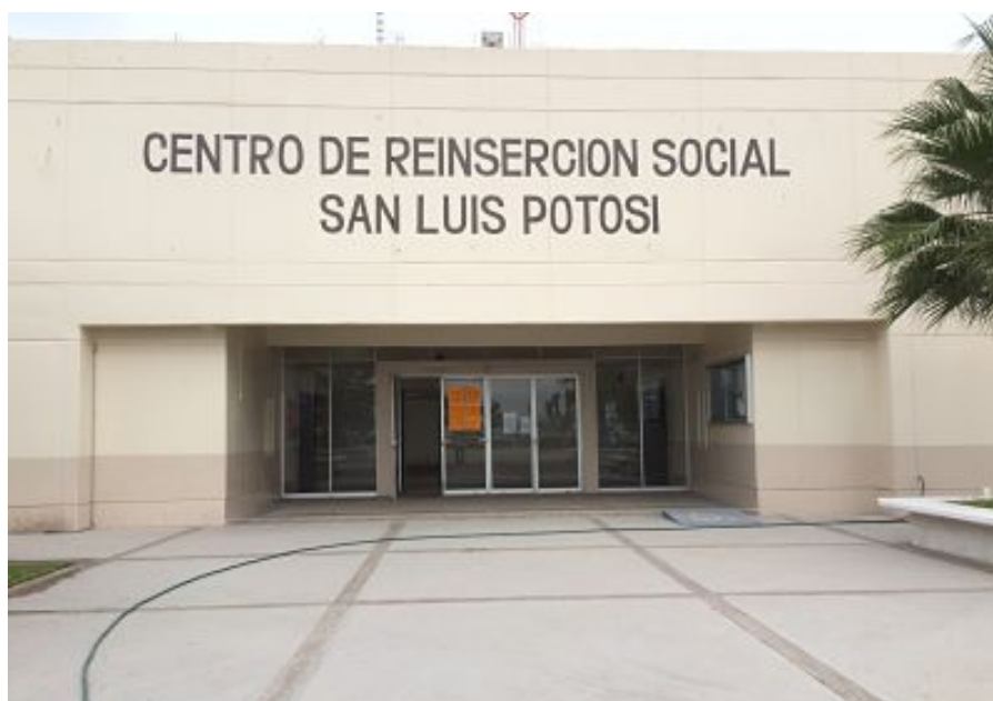
Ilustración 1: Entrada al CERESO y a sus oficinas administrativas.