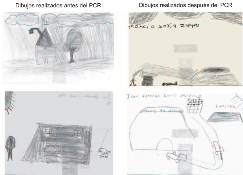
Fig. 1. Comparación de los dibujos realizados por dos niños, antes y después del programa de comunicación de riesgos en Villa de la Paz-Matchuala, S.L.P.