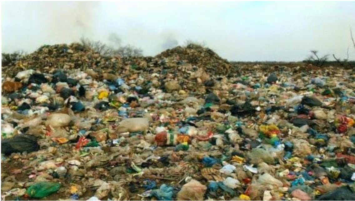
Imagen de antes del ingreso de la empresa de recolección de residuos sólidos Red Ambiental.