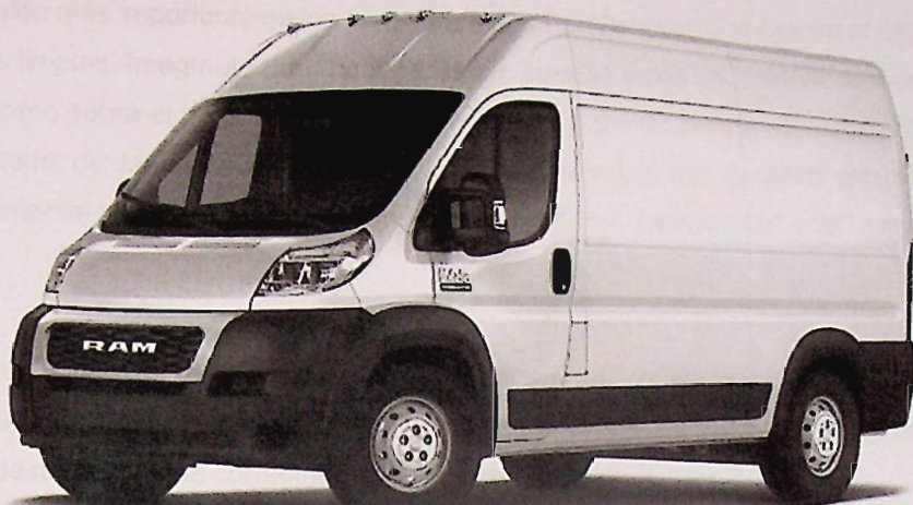
Ilustración 2|imagen 2: Prototipo del vehículo Van Chrysler Promaster Ram 2500, color Blanco.

Antes de salir de las instalaciones de CASA A, C. el conductor debe asegurarse de verificar el funcionamiento correcto del vehículo de Biblioteca Móvil.